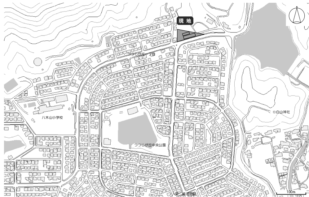
— 現地案内図 —